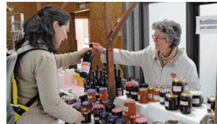
Klosterwein: Die ASC-Schwester bieten ihre Produkte am Klostermarkt an.

Klostermärkte kommen in Mode. Dabei geht es aber nicht nur um das Geschäft, wie das Beispiel aus Gossau in der Schweiz zeigt.