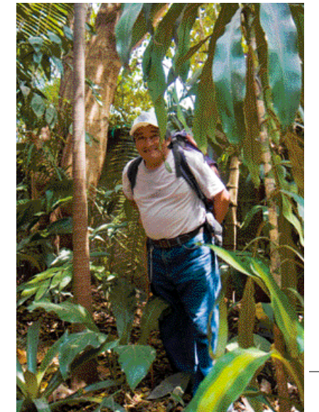
Pilger: Auf dem Weg zu den Gemeinden.