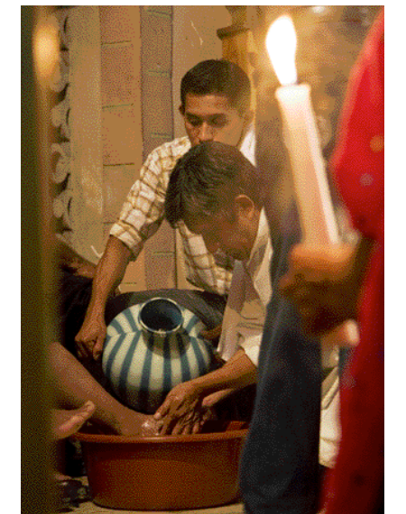
Diener: Im Zeichen der Fußwaschung.