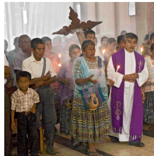
Priester: An der Seite der Armen.