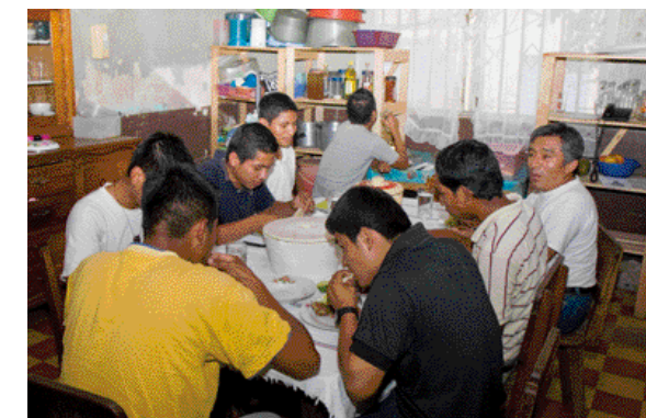
Gastfreund: Manchmal wird es eng in der bescheidenen Küche.