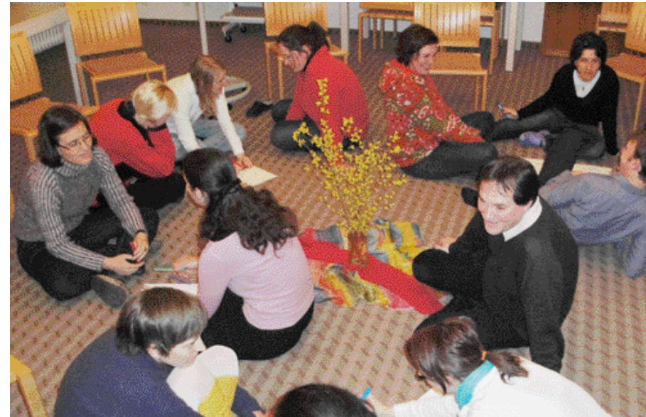
Kontakt: In der Gruppe tauschen sich die Jugendlichen über ihren Glauben aus.

Junge Erwachsene nehmen im Kloster St. Elisabeth ihr Christsein unter die Lupe und beschließen, gemeinsam Gott im Alltag zu suchen.