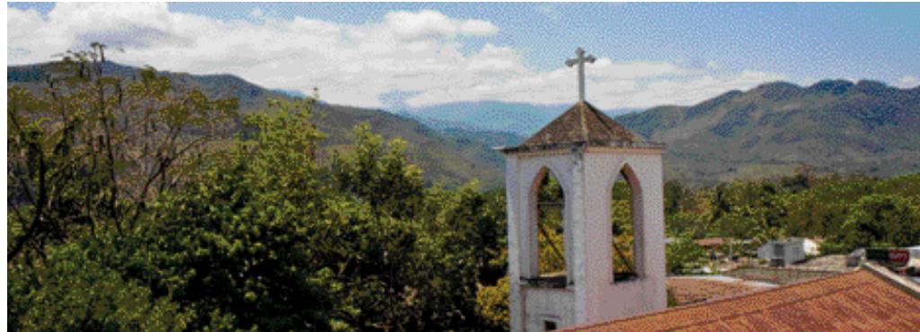
Über den Kirchturm hinaus: Die Pfarrei erstreckt sich über 60 Kilometer.

den Rohbau, auf dem nun Gras wächst. „Wir bauen eben weiter, wenn wir Geld haben.“