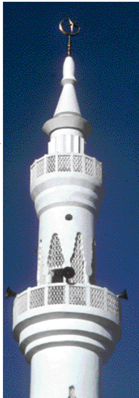
II • ASC CPPS 4-2010

TEXT: MARIJA PRANJIC ASC