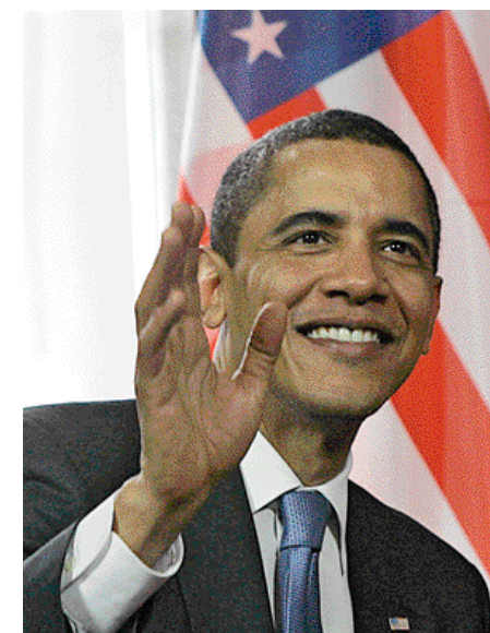
Barack Obama: Friedensnobelpreisträger 2009.

Mutter Teresa stirbt am 5. September 1997 in Kalkutta. Indien gibt ihr ein Staatsbegräbnis. In den Medien aber steht der Tod einer anderen Ikone im Vordergrund, die wenige Tage vor ihr bei einem Verkehrsunfall starb: Diana Francis Spencer, bekannt als Lady Di.