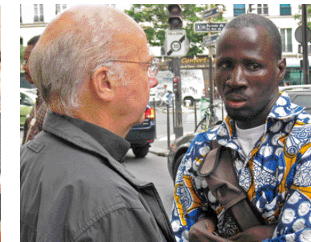
Diakonie: An der Seite der Flüchtlinge.