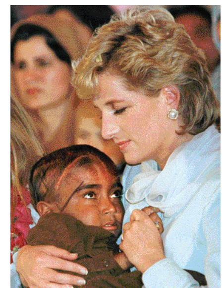
Lady Di: Sie stirbt sechs Tage vor Mutter Teresa.

Mächtigste Frau ist eigentlich ein Zitat, oder?