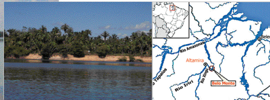
Belo Monte: An diesem Ort wird eine der Staudammbauwerke errichtet.