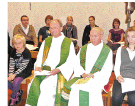
Liturgie: Eucharistiefeier mit Firmbewerbern.

In einem lebendigen Vortrag am Abend erklärt der Bischof, dass Freiheit nicht automatisch aus sich selbst heraus funktioniert. Er spricht aus eigener Erfahrung und erschließt Freiheitswege aus biblischen Erzählungen und vielfältigen konkreten Lebenssituationen. Solange Menschen Angst hätten, könnten sie nicht frei sein. „Das größte Risiko ist, gar kein Risiko einzugehen“, sagt der Bischof