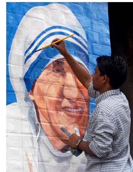
Mutter Teresa: Die mächtigste Frau der Welt.

Mächtigste Frau ist eigentlich ein Zitat, oder?